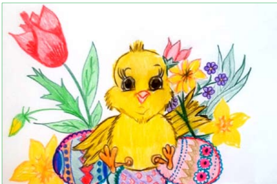
Viktória Križková, 5. B