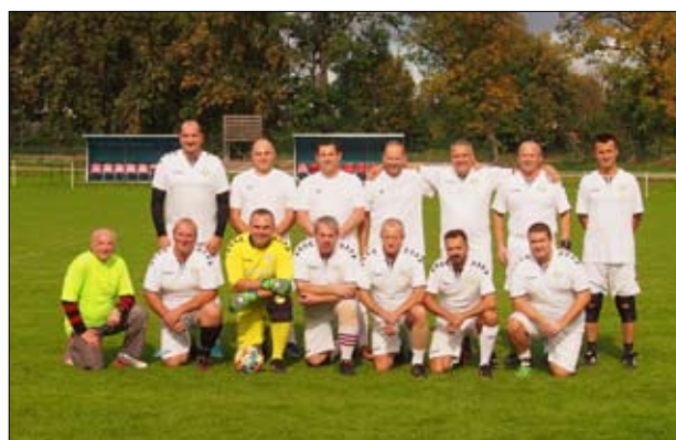
Hodové popoludnie patrilo futbalu – „Starším pánom“, ale aj deťom a nadšencom ľudovej hudby.