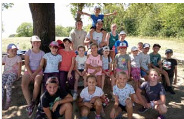
Detský tábor v znamení turistiky, súťaží, sledovania hviezd a planét, varenia dobrôt, tancovania, adrenalínu a priateľstiev.