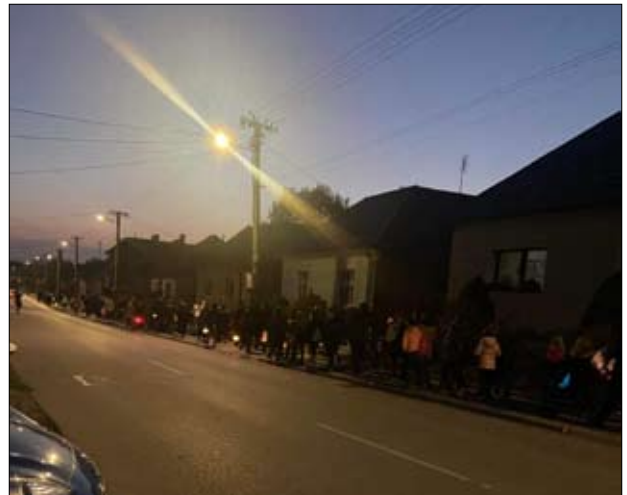
ZŠ s MŠ Jána Smreka usporiadala Lampiónový sprievod a my sme mohli byť tiež pri tom.