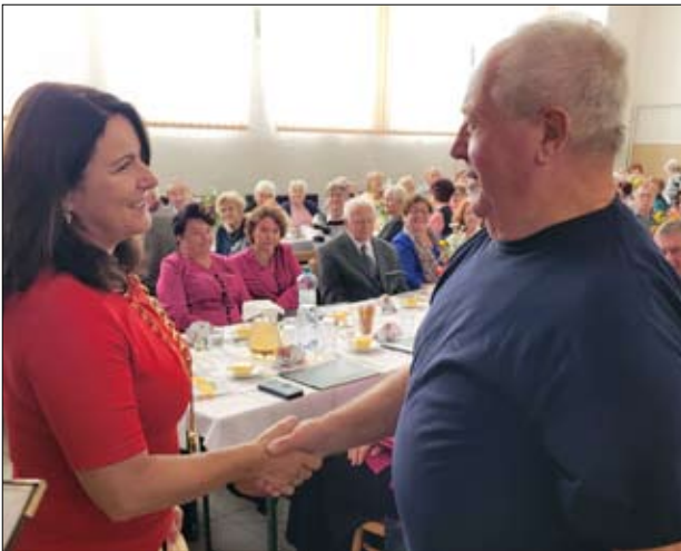
Október – Mesiac úcty k starším – hudba, milé stretnutia, blahoželania jubilantom, vystúpenia žiakov.