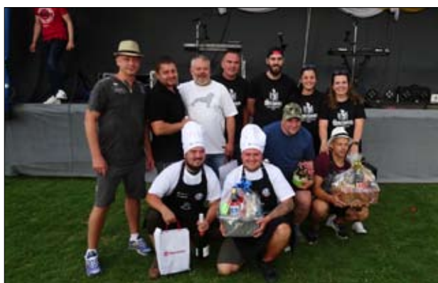
OZ Kultúra na dedine usporiadala v spolupráci s našou obcou Gulášparádu, kde sa predviedli majstri z oblasti varenia gulášov zo širokého okolia.