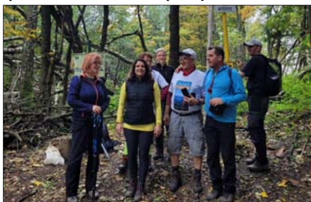
Zaniknuté osady Barošová a Dúžniky opäť „ožili“...