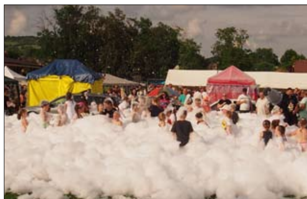
Deň obce sa niesol v znamení folklóru, dychovej a modernej hudby, dobrého jedla a detského smiechu.