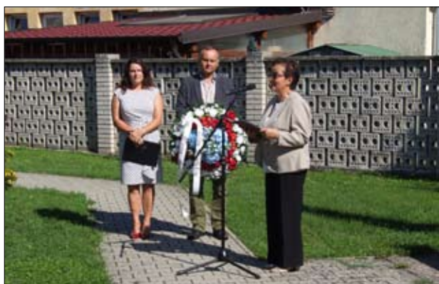
Pripomenuli sme si výročie SNP.